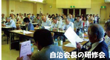
自治会長の研修会

宝塚市自治会連合会は、平成22年度の『新自治会長研修会』と『定例総合研修会』を6月24日に開催した。