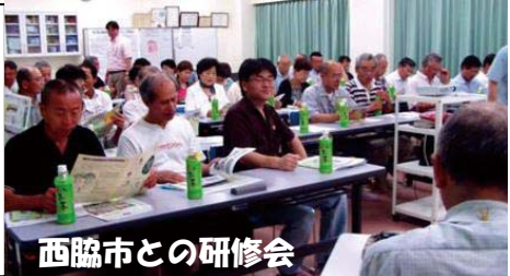
西脇市との研修会

ゆずり葉コミュニティは、西脇市日野地区人権教育協議会・自治会・地区住民の来訪を受け、研修会を7月17日に開催した。