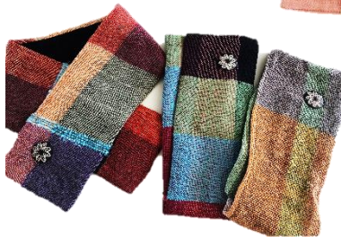
さをりミニマフラー From ネパール