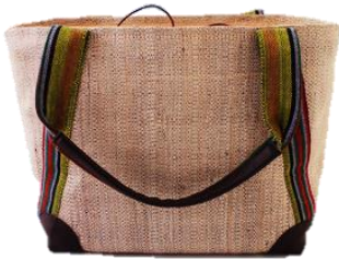
ティナラクトートバック From フィリピン

フェアトレードとは、一方的な支援ではなく、貿易を通して対等な立場で、製品の継続的な購入、販売を行い、生産者の自立に協力する活動です。講座では、国際的な女性の人権問題をフェアトレードの視点からお話いただきます。実際の製品にも触れられる、またとない機会をお見逃しなく！