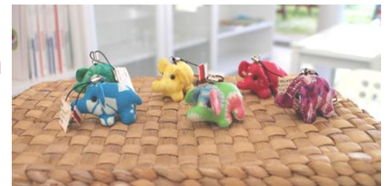
アニマルミニストラップ From インドネシア