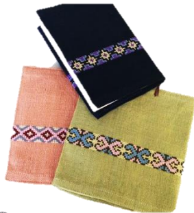
ブックカバー From タイ