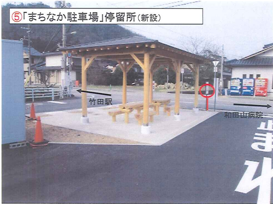
⑤「まちなか駐車場」停留所(新設)