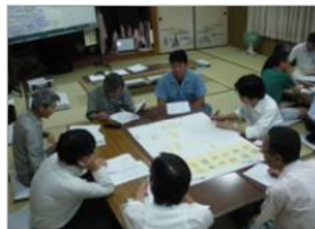
城下町八木を考える会