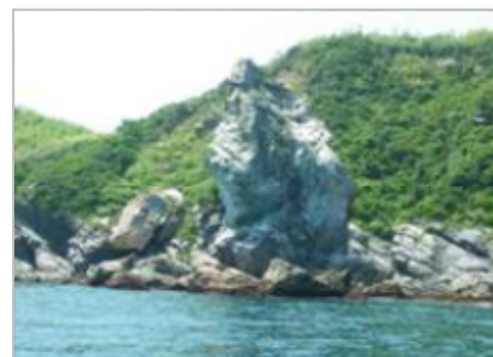
島のシボル「上立神岩」