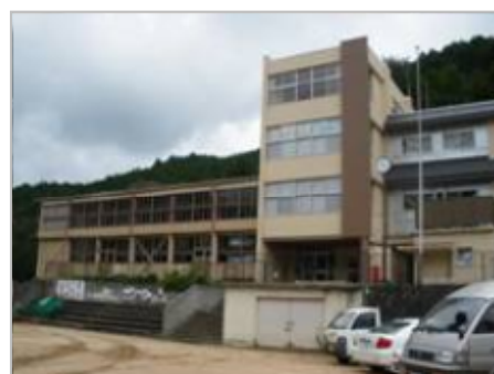
地域交流センター