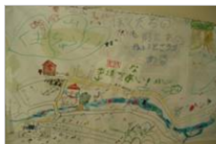
山村留学生作成の集落マップ