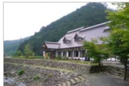
今出川親水公園、今出せせらぎ園