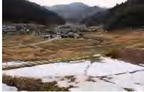
山かげの畑に雪が残る静かな里