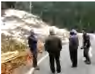
檜の木材を王子動物園の さる舎にプレゼントします！