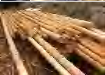
積み出しを待つ檜の丸太