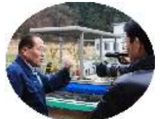
きれいな清水でほんもろこの養殖