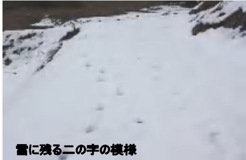
雪に残る二の字の模様

1月31日(日)曇り すっぱり雪につつまれた幻想的な冬景色を期待して薬王寺を訪れました。シャーベットの塊が道端に残され静寂だけが山里を包んでいました。野に山に降り積もった雪は時おり木立をふるわせる風の子守唄と温かい陽射しにまどろみ、いつしかその姿を消したのでしょうか。陽だまりの「旬の里のぼりお」で楽しく元気作戦の打合せ。薬王寺の魅力発見の取材冬探しに同行して頂きました。山かげに残る雪の上に二の字の足跡を発見！深くめり込んだ跡を見るとかなりの体重の持ち主？深い雪をザクザクと踏みしめて追跡すると、その足跡は山の雑木林に消えていました。山里の冬は厳しく長い、でもやがて立春です。