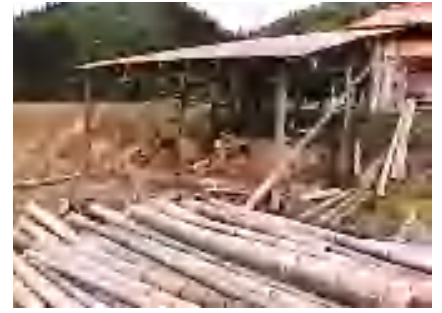
陽だまりの旬の里のぼりお 竹炭焼き小屋