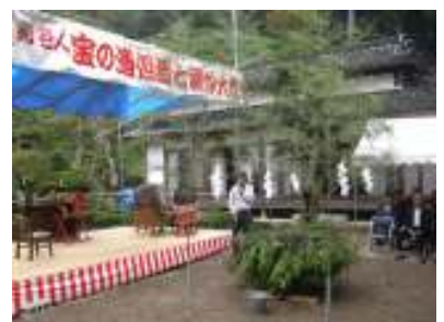
中貝市長にお越しいただきました