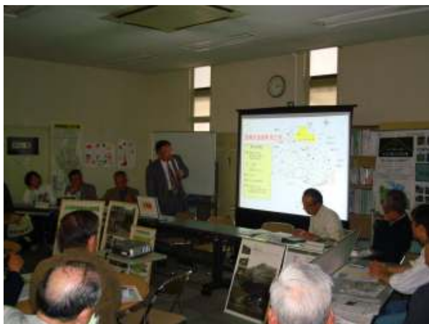
スライドを活用し、薬王寺の紹介をしました