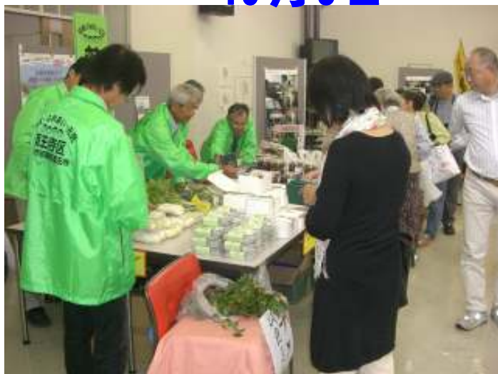
薬王寺の特産物は大好評でした