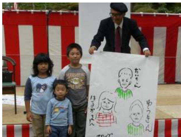
ステージで似顔絵を描いていただきました

ジャグリングや地元よさこいチームの演技、売店、ビンゴゲームなど大いに盛り上がりました。