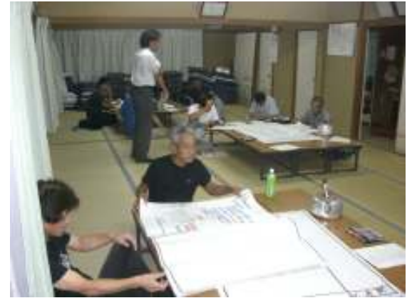
9月2日の薬王寺ワークショップの様子