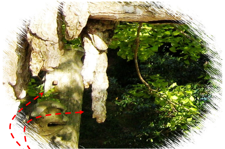
なるほど これが名前の由来だった 納得!!