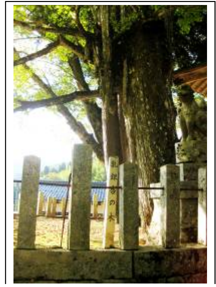
垂れ乳?の銀杏の木? うう〜ん?