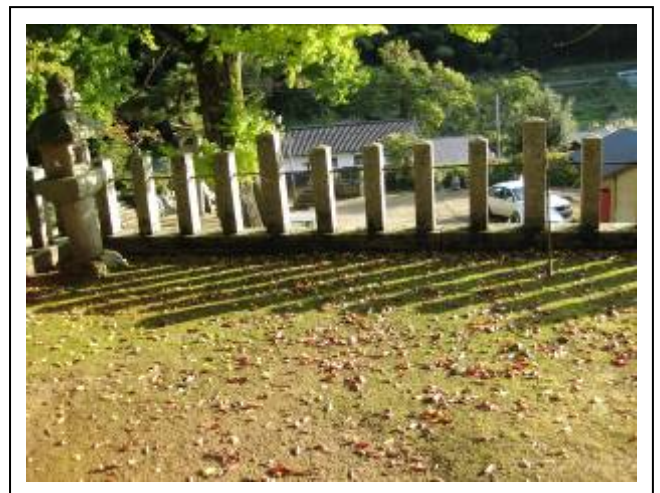
大銀杏 大地にそっと 落とし文

大生部兵主神社 境内の乳銀杏のネーミングはおもしろい! 民話や伝承話を活用して(逸話が無ければ新しく創作して) 付加価値をつけ薬王寺ブランドにしてみるというのはどうでしょう? “旬の里 のぼりお”で特産品として紹介できます。 誰も拾って食べないのはモッタイナイ!!