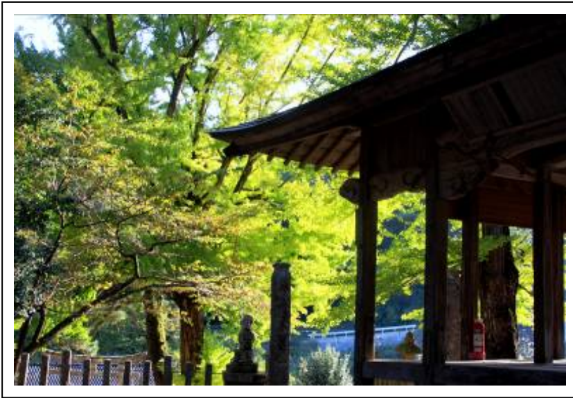
秋の陽射しをあびてひかり輝く銀杏