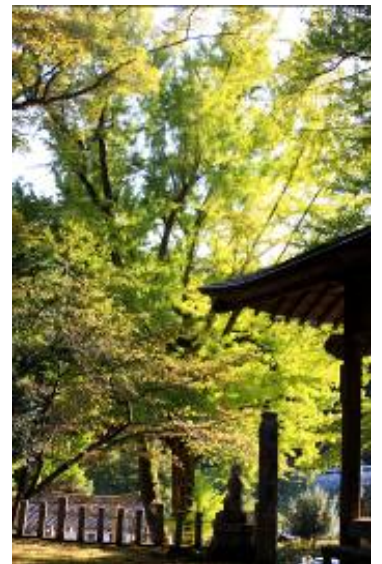
天王さんの大銀杏