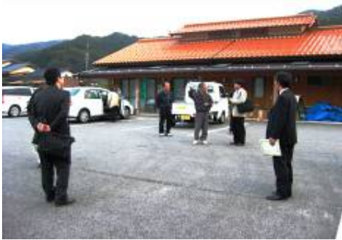
始めまして！ “旬の里 のぼりお”