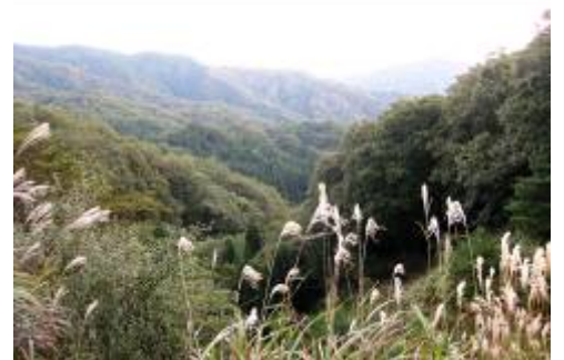
秋色に染まる集落を望み郷愁にひたる