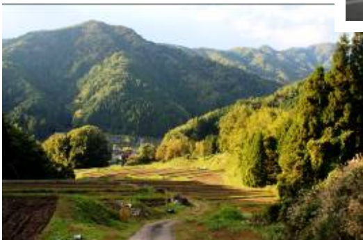
稲の収穫を終えた千枚田