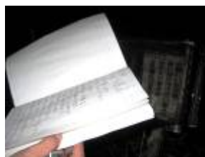
江笠山登山口の登山日記