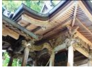
歴史の重み風格ある神社の本殿