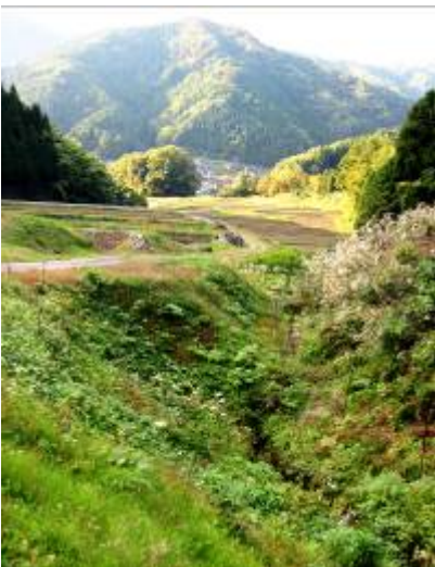
鳥のさえずりとせせらぎが谷間に響く