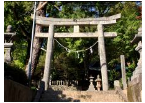
午頭大王がご祭神の大生部兵主神社