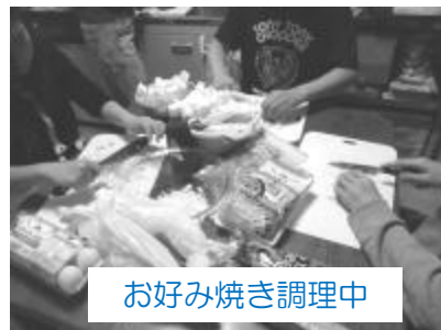
お好み焼き調理中