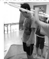
巨大! シャボン玉作り

5月は、段ボールや牛乳パック、ペットボトルを使って工作を行いました。子どもが自分の作りたいものと、弟へのお土産の車と電車 2 つを作りたいと提案し、まずはホワイトボードに作りたいものを書き起こしました。そしてスタッフと子どもが協力して材料を決め、慎重に段ボールカッターやはさみを使い、想いを形にしていきました。その子どもの熱意と想いに、スタッフも本気で工作に挑みました。あっという間に時間が過ぎ、カラフルな夢の新型新幹線と、弟への想いが詰まった車が完成しました。お迎えにお母さんと弟が来たとき、弟さんはこんなのを貰ってもいいのかな、と驚きを口にしていました。この日の工作は大満足でした。