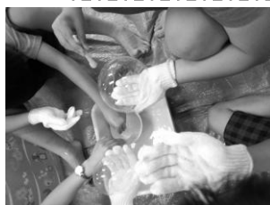
みんなでシャボン玉作り