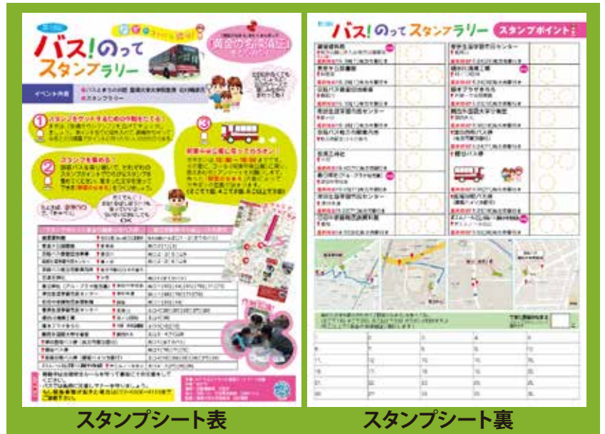
スタンプシート表