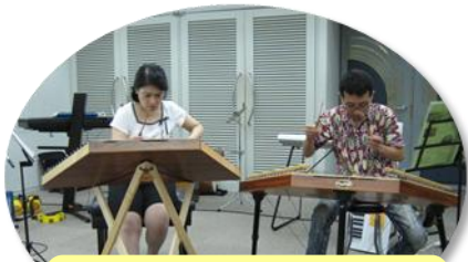
「ハンマーダルシマー」のやさしい音色に癒されました♡