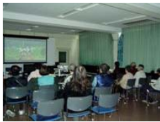
コミュニティルームの映画シアター

2月13日(土)13時から「少年H」を開催しました。バンクーバー冬季オリンピックの開会式と重なり、観客は少なかった。