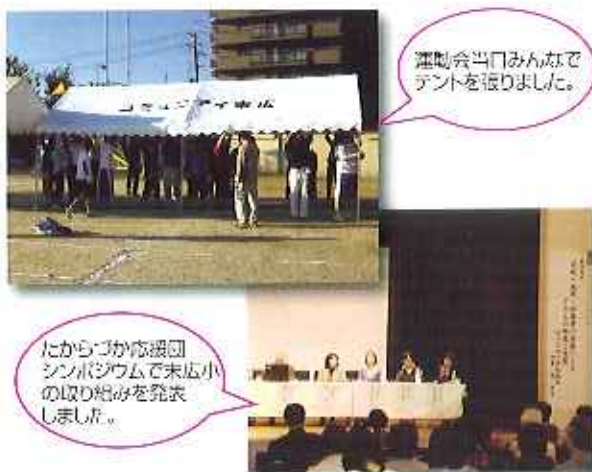
運動会当日みんなでテントを張りました。