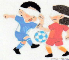
ブラインドサッカー